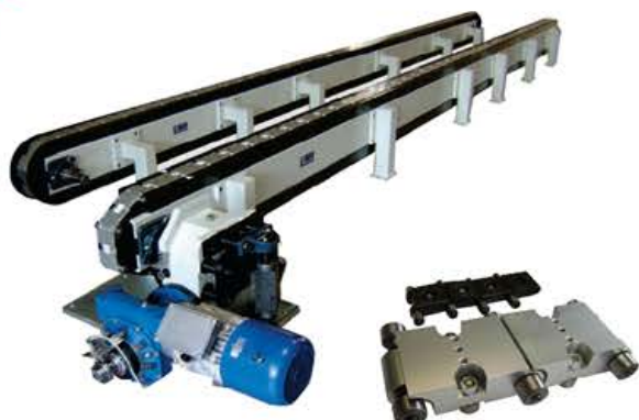
PRECISION LINK CARRIERS TRASPORTATORI A PASSO DI PRECISIONE