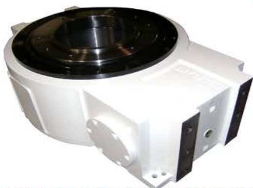
GLOBOIDALCAM INDEXING UNITS HIGH SPEED 1000 RPM TESTE A DIVIDERE A CAMMA GLOBOIDALE AD ALTA VELOCITA' 1000 C/I'

ITALPLANT DISTRIBUTORS IN THE WORLD – DISTRIBUTORI ITALPLANT NEL MONDO ITALPLANT VERTRETERN IN DER WELT – ITALPLANT DISTRIBUTEURS DANS LE MONDE