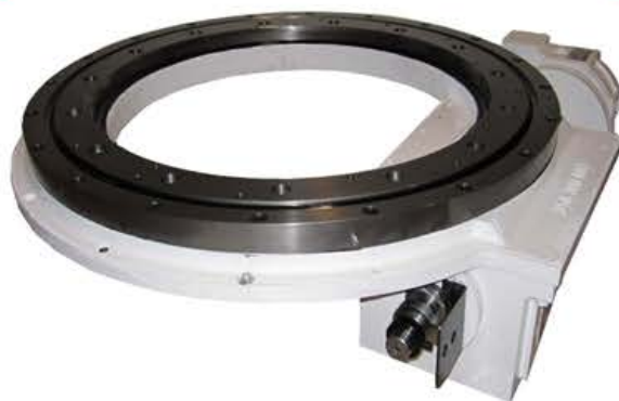
HIGH SPEED TOROIDAL INDEXERS TESTE A DIVIDERE TOROIDALI AD ALTA VELOCITA'

PLEASE CONTACT OUR TECHNICAL OFFICE FOR FURTHER INFORMATION CONTATTA IL NOSTRO UFFICIO TECNICO PER ULTERIORI INFORMAZIONI