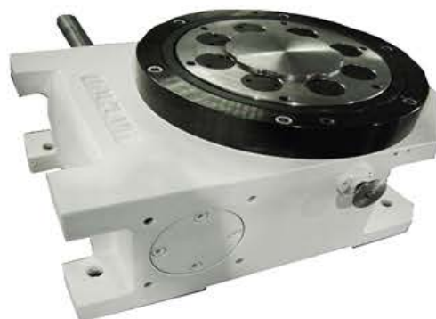
ADJUSTABLE TRANSMISSION TORQUE (ATT) WITH SAFETY OUTPUT TORQUE LIMITER (SOTL) INTERMITTORI CON REGOLAZIONE DELLA COPPIA TRASMESSA E LIMITATORE DI COPPIA DI SICUREZZA IN USCITA